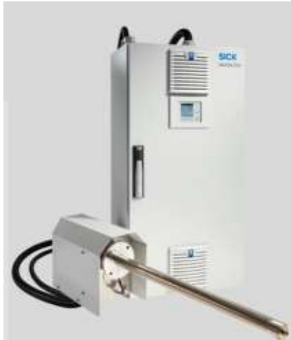
Gambar 4. CEMS