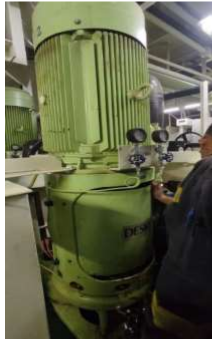
Gambar 2. Scrubber pump

Di dalam scrubber , cairan scrubber bersentuhan dengan SO x untuk menyerap dan menetralsirnya. Setelah gas buang dibersihkan melalui proses yang disebutkan di atas, sisa air dari menara pembersih dialirkan melalui serangkaian pipa dan katup, ke unit pengolahan air. Pada saat itu, sisa air sedang diolah dan tergantung pada pabrikan dan desain sistem, prosesnya dapat berubah. Umumnya terdapat pipa yang dipasang pada unit pengolahan air dengan air laut untuk menurunkan konsentrasi molekul asam sulfat, logam berat dan hidrokarbon polisiklik aromatik, antara lain komponen-komponen yang semuanya terbentuk setelah tercampurnya air laut dengan gas buang dari mesin, selama proses pembersihan di menara scrubber . Reaksi yang dihasilkan antara air laut dan sulfur dioksida adalah sebagai berikut: SO_2 + H_2O = H_2SO_3 . Ingatlah bahwa molekul sulfur dioksida dibentuk oleh 2 atom oksigen dan 1 atom sulfur. Ketika belerang dioksida dilarutkan dalam air, atom belerang bekerja dengan bilangan oksidasi 4 membentuk zat baru yang disebut asam belerang atau H 2 SO 3 (Nelson Gustavo D.D, 2020).