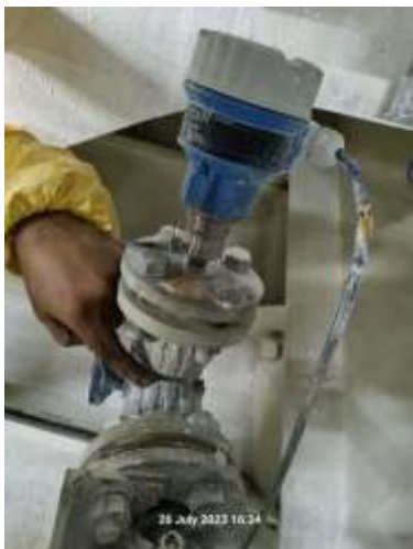
Gambar 8. Retaknya Pressure Transmitter