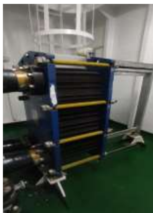
Gambar 6. Cooler

Dari kondisi ini maka yang jadi pokok permasalahan akibat terjadinya kendala pada monitoring system, scrubber mengalami stop running adalah :