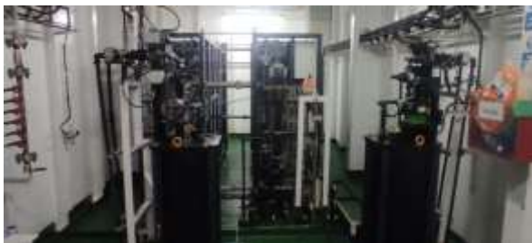
Gambar 5. Water treatment unit