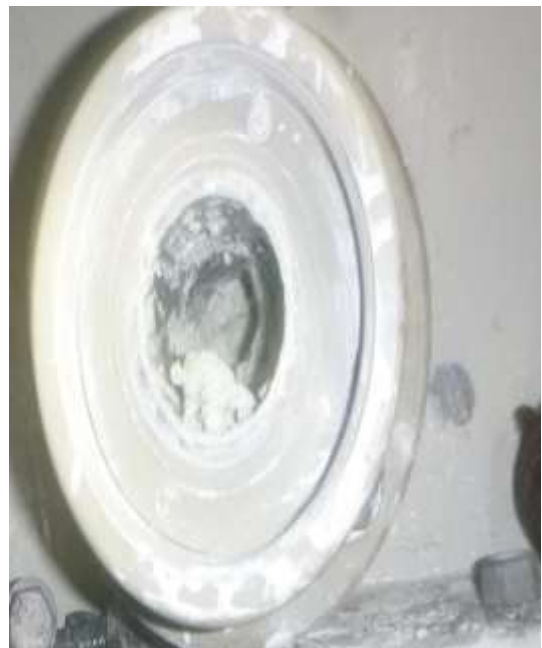
Gambar 7. Penyumbatan pada pipa air kapur

2. Kerusakan pada pressure transmitter Pressure Transmitter adalah sebuah alat pembacaan tekanan tangki/pipa langsung pada display alatnya yang memungkinkan pengguna dapat langsung melihat nilai dari pada tekanan terukur tersebut. Air kapur yang sudah menumpuk menjadi penyebab kerusakan Pressure transmitter . Air kapur yang terus dipompa dengan pressure tinggi, dan pipa yang sudah tersumbat mengakibatkan kerusakan pada transmitter.