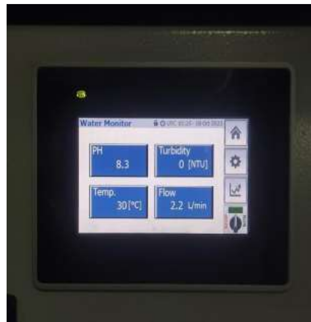
Gambar 3. Water monitoring unit